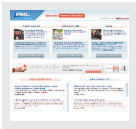
Il progetto speciale Telecom Impresa Semplice su PMI.it

torialità con una spiccata versione mobile correlata. I banner su mobile non mi sembrano il modo migliore di valorizzare questi progetti e le loro specifiche dinamiche di navigazione, sarà interessante capire come evolverà il mercato in questa direzione. L'altro tema che dovremo affrontare sarà la progressiva comparabilità del mezzo internet con la tv e quindi l'aggiunta tra i parametri di pianificazione del web dell'unità di misura Grp. Capire quindi quali tecnologie andranno usate e quali variabili saranno più importanti per una corretta valutazione dell'advertising sarà fondamentale. L'incognita dei prossimi 18 mesi è data dalla diffusione dell'iPad: quale diffusione avrà tra gli editori e quali modelli di business si applicheranno a questo nuovo driver?